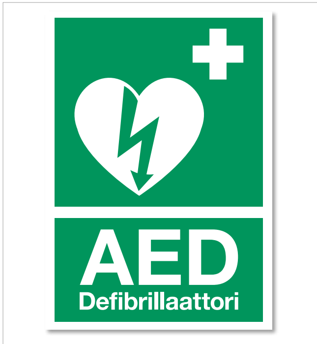
3001-FI / 3204-FI / 3205-FI