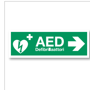
3004-FI / 3202-FI